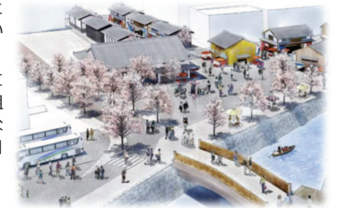
図 歴史・文化関連施設の整備イメージ

そのため、都市構造再編集中支援事業を活用することにより、交流施設や交流広場の整備を基幹事業として取り組むとともに、回遊性や滞留性の向上を図るため、「まちなか回遊道路整備事業」や高質空間形成を取り入れた「春日本通り線整備事業」を基幹事業として取り組みます。