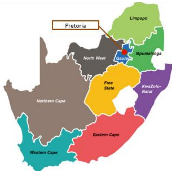
図 1 南アフリカ地図